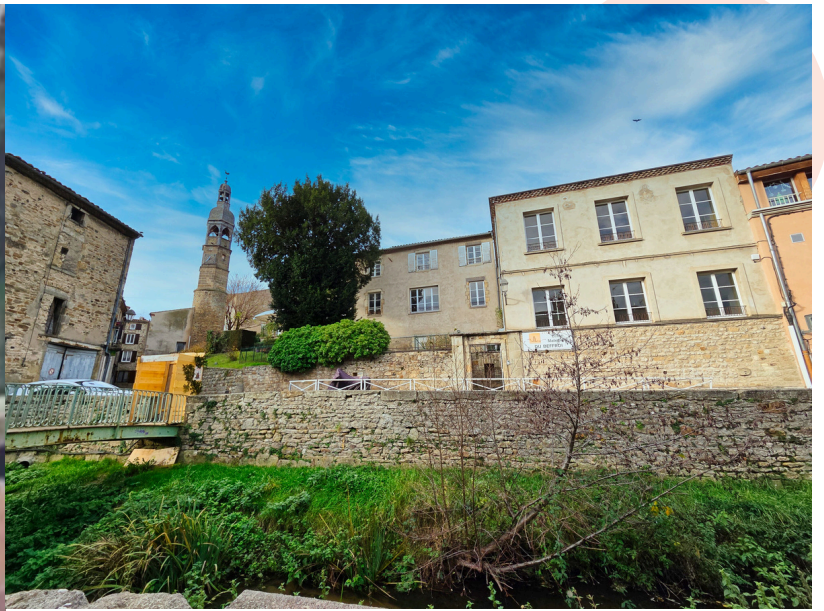
Ci-contre : Géoportail localisation des espaces/ Ci-dessus : Plan large façade depuis la rue.

Plan de géomètre : voir annexe 1 Diagnostics : voir annexe 2