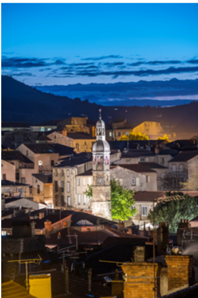
A gauche : vue aérienne du Beffroi, de nuit.

ANCIENNE ECOLE MATERNELLE DU BEFFROI – Cœur historique Commune de BILLOM (4 920 hab.) Centre ancien – 12 quai du Terrail.