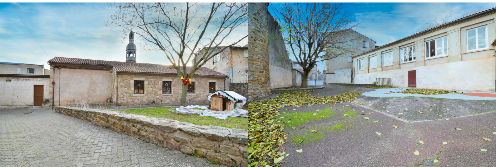
A gauche : vue extérieure côté place de la Prévotat.